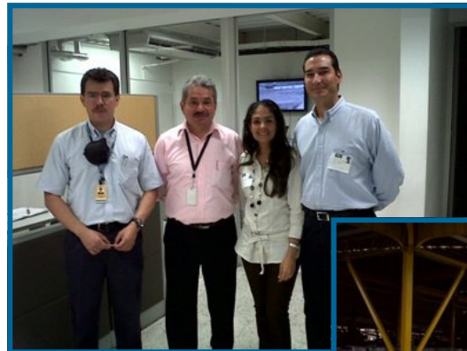
Planta Baterías MAC