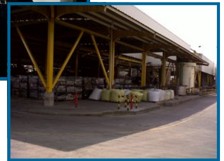
Planta Baterías MAC