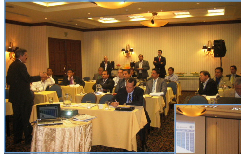
En las Fotografías: el Sr. Fermín Cuza, Presidente Internacional de la OMB, dirigiéndose a los Representantes de Capítulos BASC, mientras expone su informe de Gestión del 2010.

oportunidad de conocer a fondo el informe de gestión del año 2010, así como el plan de acción de la Presidencia Internacional y la Gerencia General de la OMB para el 2011. Estas reuniones son un escenario para que los Capítulos participen activamente en las decisiones que trazan los objetivos estratégicos y planeación de la Organización en un futuro próximo.