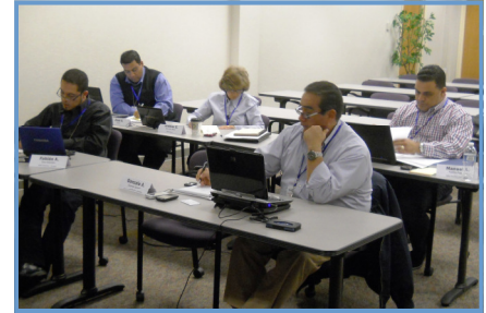
Parte del grupo de Auditores Internacionales, trabajando en los talleres.