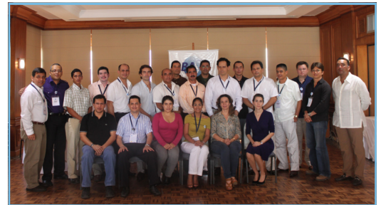
XXVII Promoción de Auditores certificados por la OMB.

La Organización Mundial BASC da la bienvenida a estas nuevas promociones de auditores internacionales.