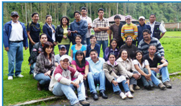
Asistentes al Primer Encuentro Nacional de Auditores Internos BASC en Quito.

Para mayor información sobre las próximas actividades, lo invitamos a visitar la página web: www.basc-pichincha.org