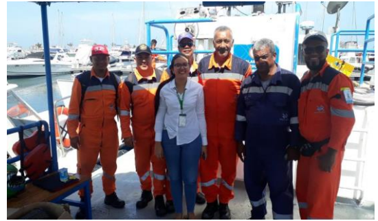
Charla de sensibilización BASC- BASC Dirigido a: Marítima Del Caribe S.A.S. - Fecha: Septiembre 11 de 2019 Asistencia: 9 personas.