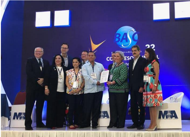
Firma Acuerdo de Cooperación entre World BASC Organization y La Asociación de Agentes Aduanales y Operadores Logísticos de la Florida (FCBF)