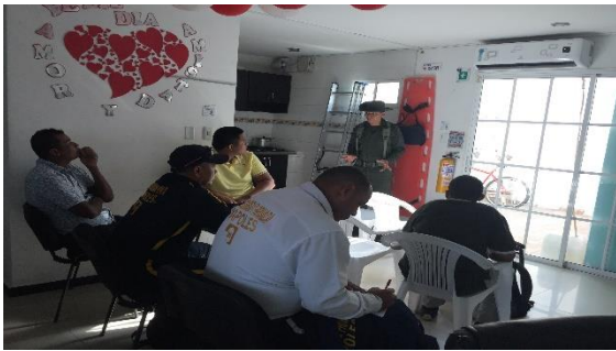
Charla de prevención frente al consumo de sustancias psicoactivas/Charla de sensibilización BASC – POLAN/BASC Dirigido a: Seguridad Nápoles LTDA.- Fecha: Septiembre 16 de 2019 Asistencia: 9 personas.