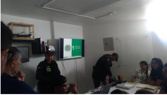
Charla de prevención frente al terrorismo e identificación de explosivos - SIJIN Dirigido a: Augustea Grancolombia S.A - Fecha: Junio 21 de 2019 Asistencia: 14 personas.