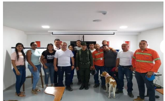
Charla de prevención frente al consumo de sustancias psicoactivas-POLAN Dirigido a: Agencia Logística Del Caribe S.A.S - Fecha: Septiembre 7 de 2019 Asistencia: 17 personas.