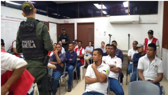
Charla de prevención frente al secuestro y extorsión - GAULA Dirigido a: C.I Técnicas Baltimé de Colombia S.A - Fecha: Julio 25 de 2019 Asistencia: 49 personas.