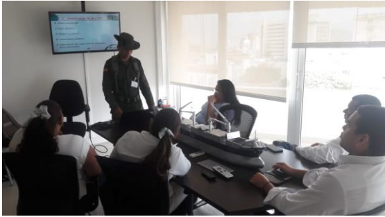
Charla de prevención frente a LA/FT - POLAN Dirigido a: Deep Blue Ship Agency S.A.S - Fecha: Agosto 26 de 2019 Asistencia: 8 personas.