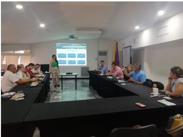
Plan de Desarrollo Portuario Santa Marta 2020-2023 / BASC-FITAC Fecha: Agosto 20 de 2019