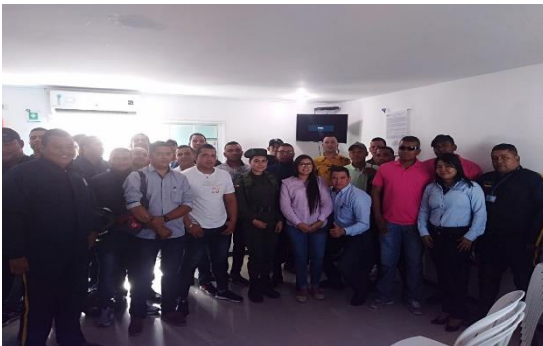
Charla de sensibilización BASC/Charla de prevención frente al narcotráfico – BASC/POLAN Dirigido a: Seguridad Nápoles LTDA.- Fecha: Julio 12 de 2019 Asistencia: 31 personas.