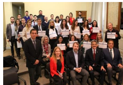
Momentos del curso de auditores BASC-OEA en Argentina

secretaría de ASAPRA y la Asociación de Despachantes de Agentes de Aduana (ADAU). La Organización a través de sus contactos y empresas miembros certificadas ha consolidado proyectos muy firmes para establecer la presencia BASC en Argentina y Uruguay. El trabajo en conjunto evidencia el interés por parte del sector empresarial, las agremiaciones y gobierno de ambos países en establecer la cultura BASC y sumarse a la red global de World BASC Organization y sus capítulos miembros.