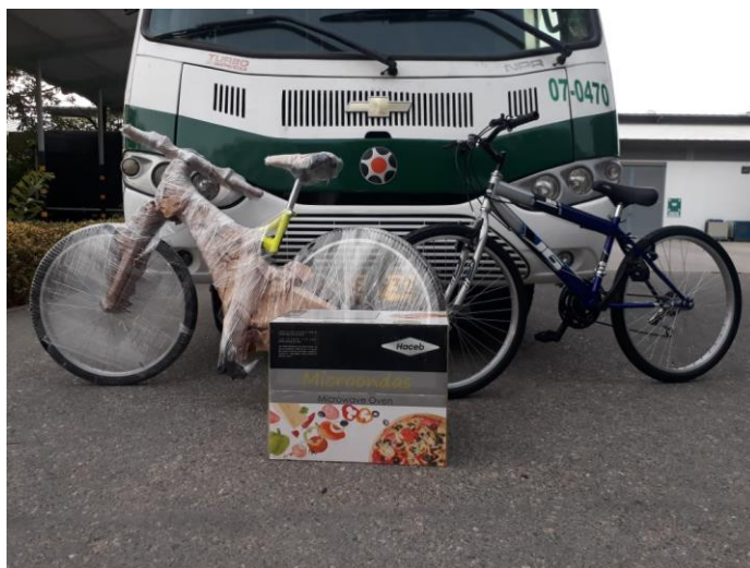
Donación Policía Antinarcoáticos Fecha: Agosto 5 de 2019