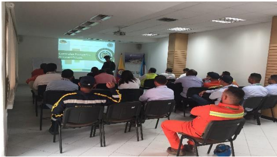
Charla de prevención frente al consumo de sustancias psicoactivas - POLAN Dirigido a: Sociedad Portuaria Regional De Santa Marta S.A.S Fecha: Agosto 28 de 2019 Asistencia: 27 personas.