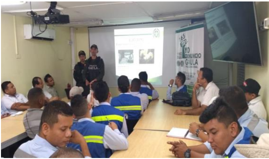
Charla prevención frente a secuestro y extorsión - GAULA Dirigido a: Servicios Técnicos Bananeros S.A- Fecha: Julio 9 de 2019 Asistencia: 34 personas.