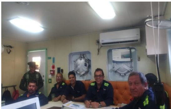
Charla de prevención frente al consumo de sustancias psicoactivas-POLAN Dirigido a: Augustea Grancolumbia S.A.S- Fecha: Septiembre 5 de 2019 Asistencia: 7 personas.