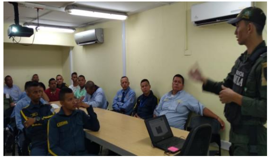
Charla Prevención frente al secuestro y extorsión – GAULA Dirigido a: C.I. Técnicas Baltime De Colombia S.A – Fecha: Julio 11 de 2019 Asistencia: 16 personas.