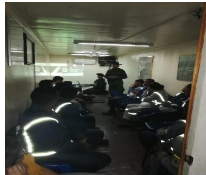
Charla Prevención frente a LA/FT-POLAN Dirigido a: Opción Logística Integral S.A.S - Fecha: Julio 18 de 2019 Asistencia: 10 personas.