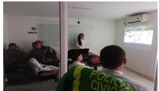
Charla de Sensibilización BASC – BASC Dirigido a: Servitanques De La Costa S.A.S – Fecha: Agosto 5 de 2019 Asistencia: 10 personas.