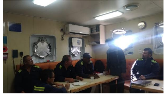
Charla de Prevención frente a Lavado de activos y financiación del terrorismo – POLAN Dirigido a: Augustea Grancolombia S.A - Fecha: Julio 4 de 2019 Asistencia: 8 personas.