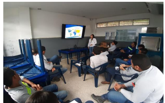
Charla de sensibilización BASC - BASC Dirigido a: Incolab Services Colombia S.A.S - Fecha: Agosto 22 de 2019 Asistencia: 14 personas.