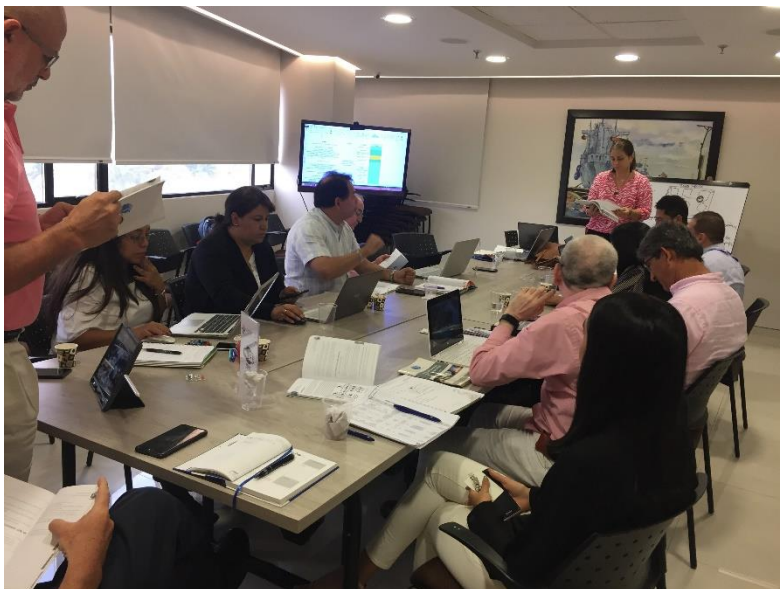
Primer Encuentro de Auditores BASC Costa Caribe Fecha: Septiembre 4 de 2019