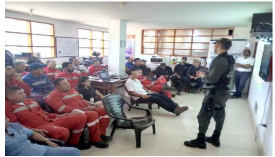
Charla de prevención frente al secuestro y extorsión – GAULA Dirigido a: Baupres S.A.S y Transportes Marítimos Arboleda S.A.S Fecha: Agosto 28 de 2019 Asistencia: 38 personas.