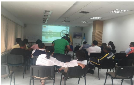
Charla de prevención frente al consumo de sustancias psicoactivas–POLAN Dirigido a: Sociedad Portuaria Regional De Santa Marta S.A- Fecha: Agosto 21 de 2019 Asistencia: 41 personas.