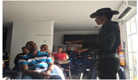
Charla de sensibilización BASC/ Charla de prevención frente a LA/FT- POLAN/BASC Dirigido a: Seguridad Nápoles LTDA. - Fecha: Julio 26 de 2019 Asistencia: 24 personas.