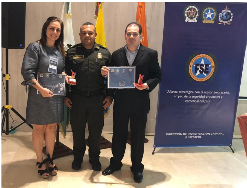
Reconocimiento otorgado por el Frente de Seguridad Empresarial a BASC Capítulo Santa Marta

Charla “El lavado de activos una amenaza centenal”