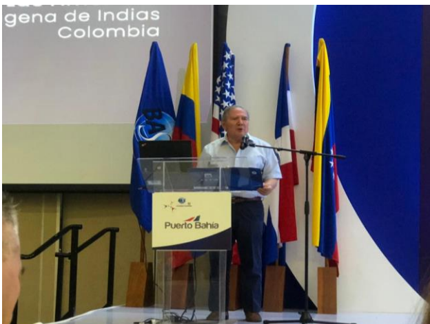
Doctor Guillermo Botero- Ministro de defensa de Colombia, encargado de la instalación del congreso