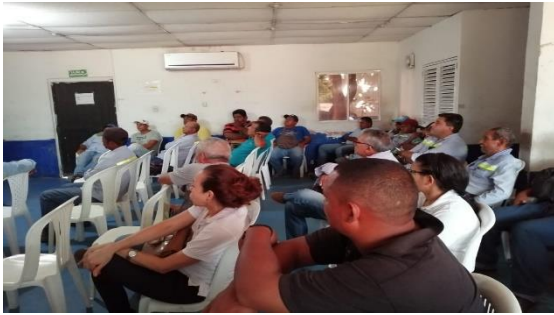
Charla de prevención frente al consumo de sustancias psicoactivas - POLAN Dirigido a: Transportes Mejía Cortés S.A.S. - Fecha: Septiembre 7 de 2019 Asistencia: 34 personas.