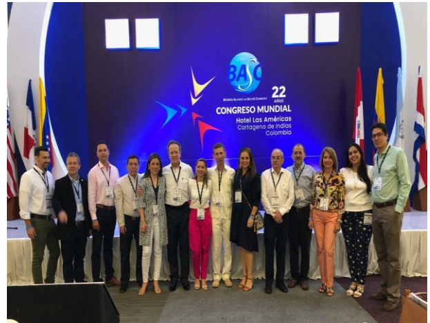
Directores ejecutivos capítulos regionales Colombia y presidentes de junta directiva capítulos regionales Colombia