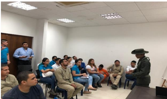
Charla de prevención frente a LA/FT - POLAN Dirigido a: Knight S.A.S- Fecha: Julio 26 de 2019 Asistencia: 27 personas.