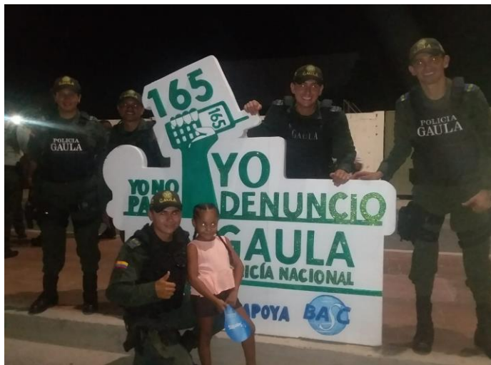
Donación GAULA Fecha: Julio 25 de 2019