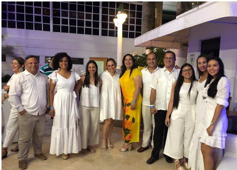
Asociados BASC Santa Marta