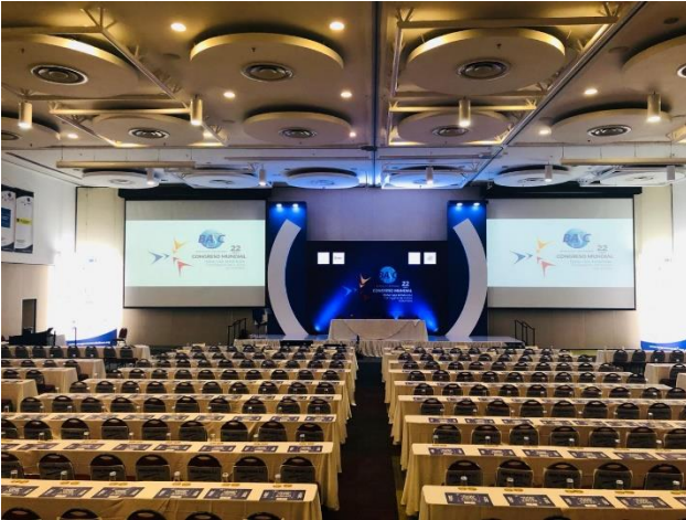
Escenario Congreso Mundial BASC 2019