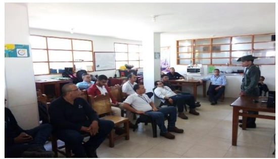
Charla de prevención frente al narcotráfico – POLAN Dirigido a: Baupres S.A.S y Transportes Marítimos Arboleda S.A.S Fecha: Septiembre 18 de 2019 Asistencia: 33 personas.