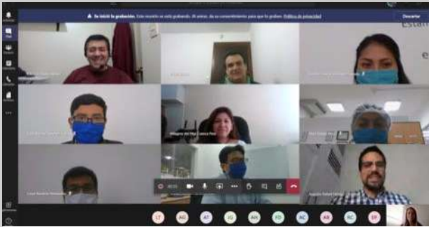
San Miguel Fruits S.A