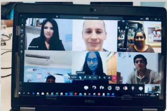
DSM MARINE LIPIDS PERÚ S.A.C (sede Piura)